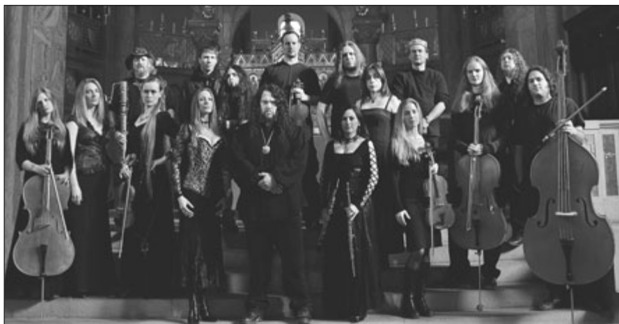
Německá skupina Haggard představí unikátní spojení metalové a vážné hudby v klasickém nástrojovém obsazení

Tím však výčet mistrů tohoto žánru rozhodně nekončí. Velkému zájmu fanoušků