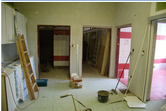
rekonstrukce dětského oddělení JIP