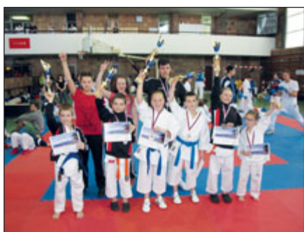
Medailisté ukazují radost z úspěchu