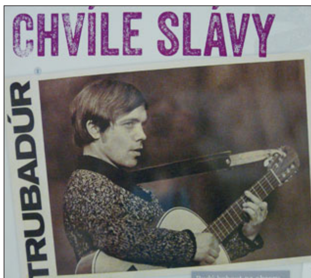
Na panelech jsou k vidění fotografie z Krylova života od jeho dětství až po devadesátá léta.

a vrchol jeho slávy se návštěvníci hodonínského kina dostali až po Poslední dějství a Epilog. Jednotlivé panely jsou pojmenované podle kapitol Čermákovy knihy