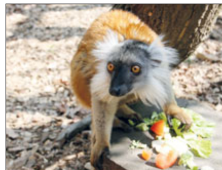
Také lemuri černí jsou v hodonínské zoo už doma.

„Svému předchůdci v expozici se dost podobají, jsou ale menší,“ řekla na adresu příchozích, kteří jsou v českých zahradách k vidění jen vzácně, zooložka Lenka Pacíková. Teju s černou kůží s bílými skvrnami a dlouhým ocasem sice do Hodonína přišli prostřednictvím Zoo Plzeň z USA, ale jejich domovinou je Jižní Amerika. „Tato zvířata se vyznačují velkým apetitem. Jsou doslova žravá a hamtavá. Stačí, když chovatel nešikovně podá krmení a může se dočkat pořádného kousance,“ prozrazuje zooložka. Plazi, již se převážně živí hmyzem, drobnými savci a ovocem, se v zoo zabydleli rychle. „Už si užívají i bazénku,“ hlásila hned druhý den po jejich příchodu chovatelka Jitka Ebertová. Pokračování na str. 6