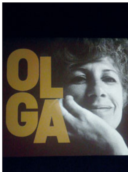
Postmoderní dokument ukazuje soukromou sféru Havlových představovanou Olgou.

Půlkacíř. Výstava byla vytvořená pro festival Stoptime a podílel se na ní především Vojtěch Klímt, Krylův znalec a propagátor. V Hodoníně se expozice zdržela do neděle 18. května. „Jsou i další města, která na ni čekají,“ vysvětlil ředitel domu kultury Marcel Řimák s tím, že spojil výstavu s předpremiérou dokumentárního filmu Olga a následného přímého přenosu koncertu The Plastic People of the Universe. „Zdálo se mi vhodné vzdání holdu jak osobě Karla Kryla, tak i Olze Havlové. Jsou to dvě osobnosti, které se nezapomenutelně zapsaly do našich dějin. Vzpomínku si určitě zaslouží,“ popsal Řimák.