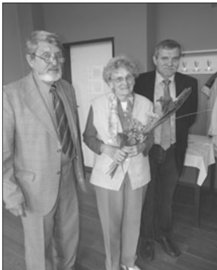
Devadesátku ve svazu důchodců letos oslavila hodonínská občanka.

Všem jubilantům ze Svazu důchodců Hodonín blahopřejeme a také přejeme za redakční radu mnoho zdraví do dalších let. -bla-