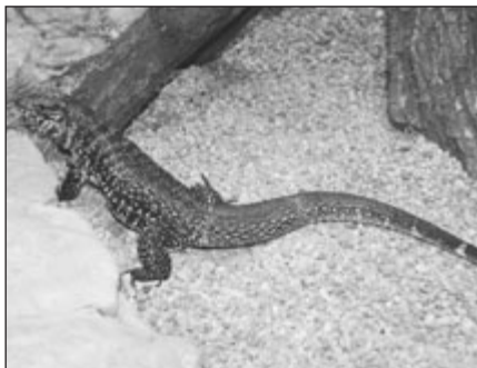
Teju žakuarů se ve svém teráriu zabydleli nezvykle brzy.

To pětice lemuru černých, která přišla z pražské zoo, byla několik dnů zakřiknutá. Jediné mládě ve skupině se úzkostlivě drželo mámy a i ostatní byli zalezlí v boudičkách. Stres po cestě a také z nového prostředí na ně hodně zapůsobil. „Až dosud žili pouze v zázemí pražské zoo, takže nejsou zvyklí na lidi,“ omlouvali vystrašené lemury chovatelé. Dnes už ale mluví jinak. „Jsou mimořádně živí, dokonce až oprsklí,“ říká Bílková na adresu roztomilých zvířátek s očima jako korálky a protáhlým čumáčkem. Vzápětí je ale chválí. „Jsou hodná a kontaktní. Když jim dávám z ruky, přijdou a vezmou si. Lidé je už teď mají rádi,“ chválí Bílková příslušníky skupinky černých lemuru, kteří našli nový