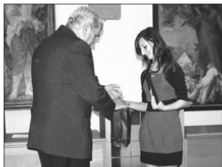
Studentům předali diplomy v obřadní síni radnice.