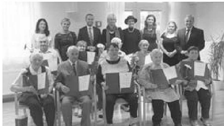
Nejstarší účastnice kurzu letos oslavila 93. narozeniny.